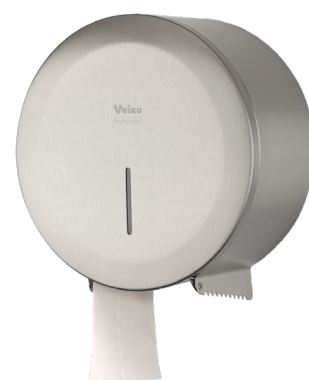
VEIRO JUMBO STEEL

Широко применяется в местах общественной гигиены с высокой и средней проходимостью в Офисных и Административных зданиях, заведениях сегмента HoReCa, Медицинских учреждениях, на объектах Транспорта, Спортивных объектах.