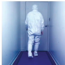
• переходные шлюзы