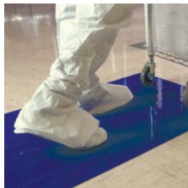
• пешеходные дорожки